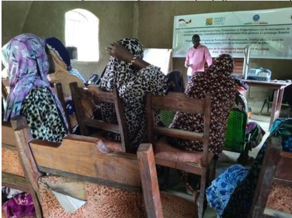
Photo 9: séance de démonstration pratique à Selingue avec l'équipe de Sun4Water