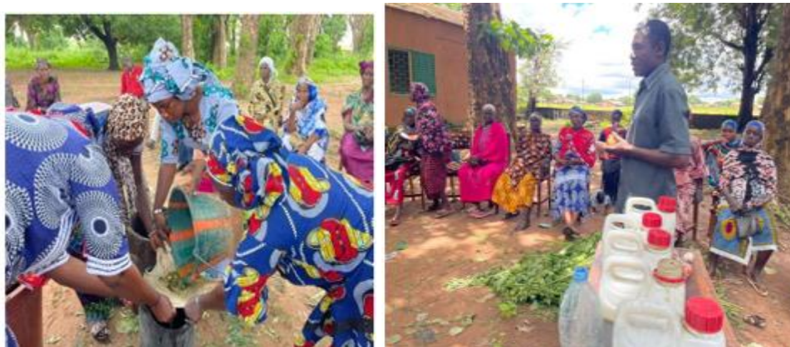
Photo 1: Session de formation des femmes sur la production d'engrais liquide bio

Ces orientations permettront de renforcer l'impact et la durabilité des interventions en 2026.